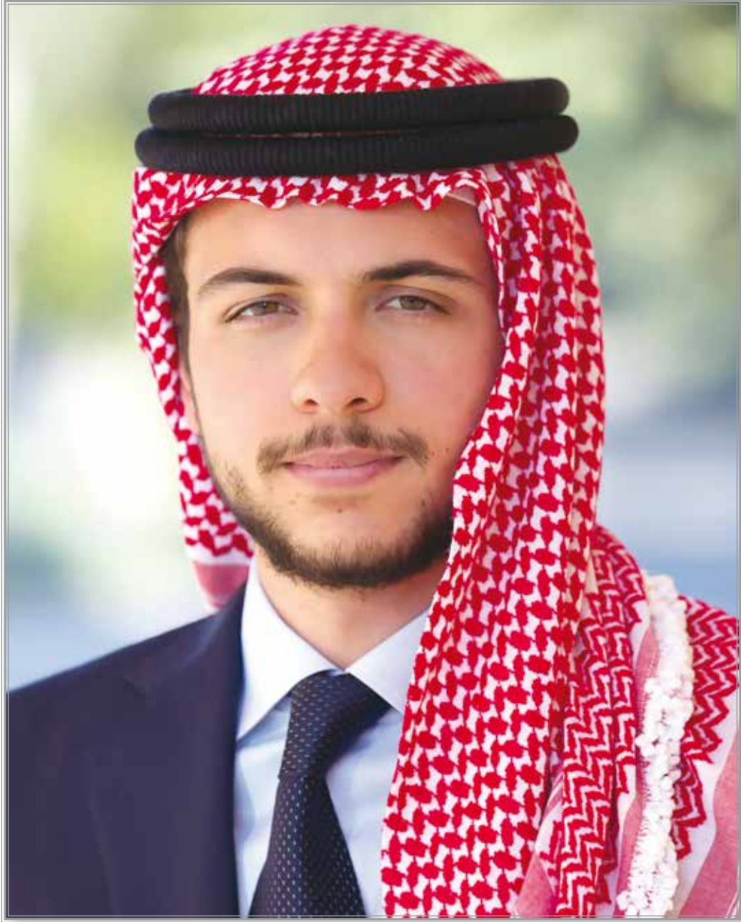
حضرة صاحب السمو الملكي الأمير حسين بن عبد الله ولي العهد حفظه الله ورعاه