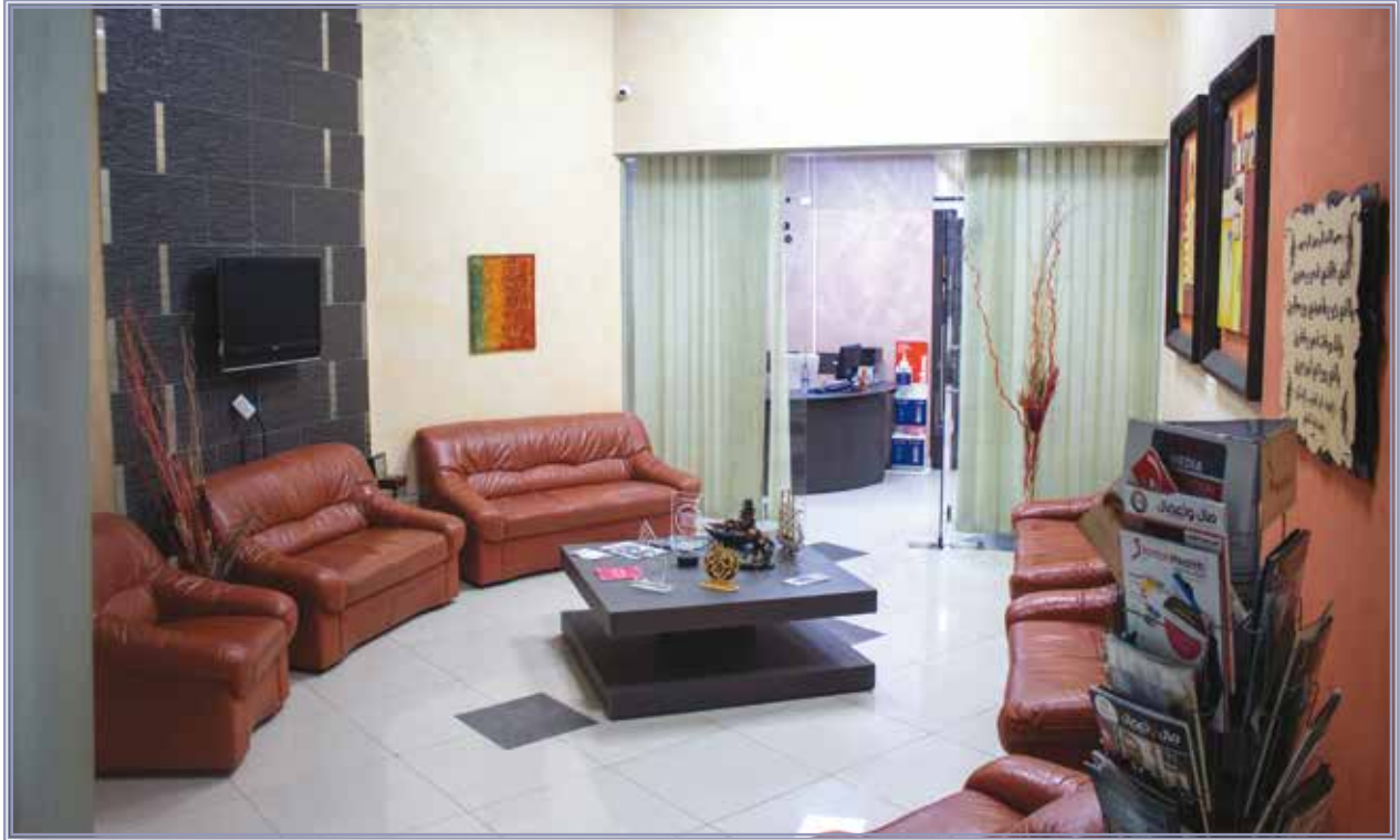
قسم الجراحة التجميلية