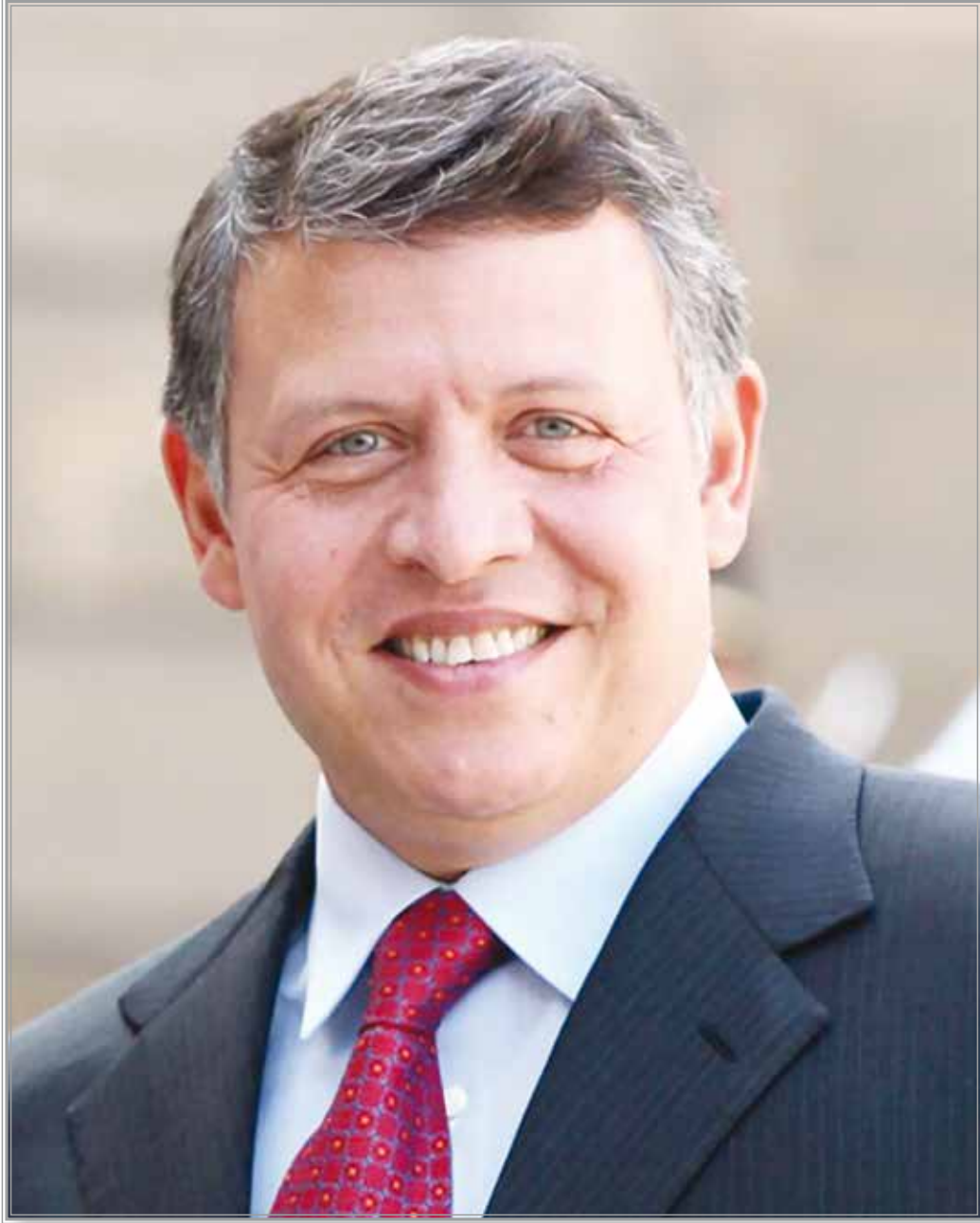
حضرة صاحب الجلالة الهاشمية الملك عبد الله الثاني ابن الحسين المعظم حفظه الله ورعاه