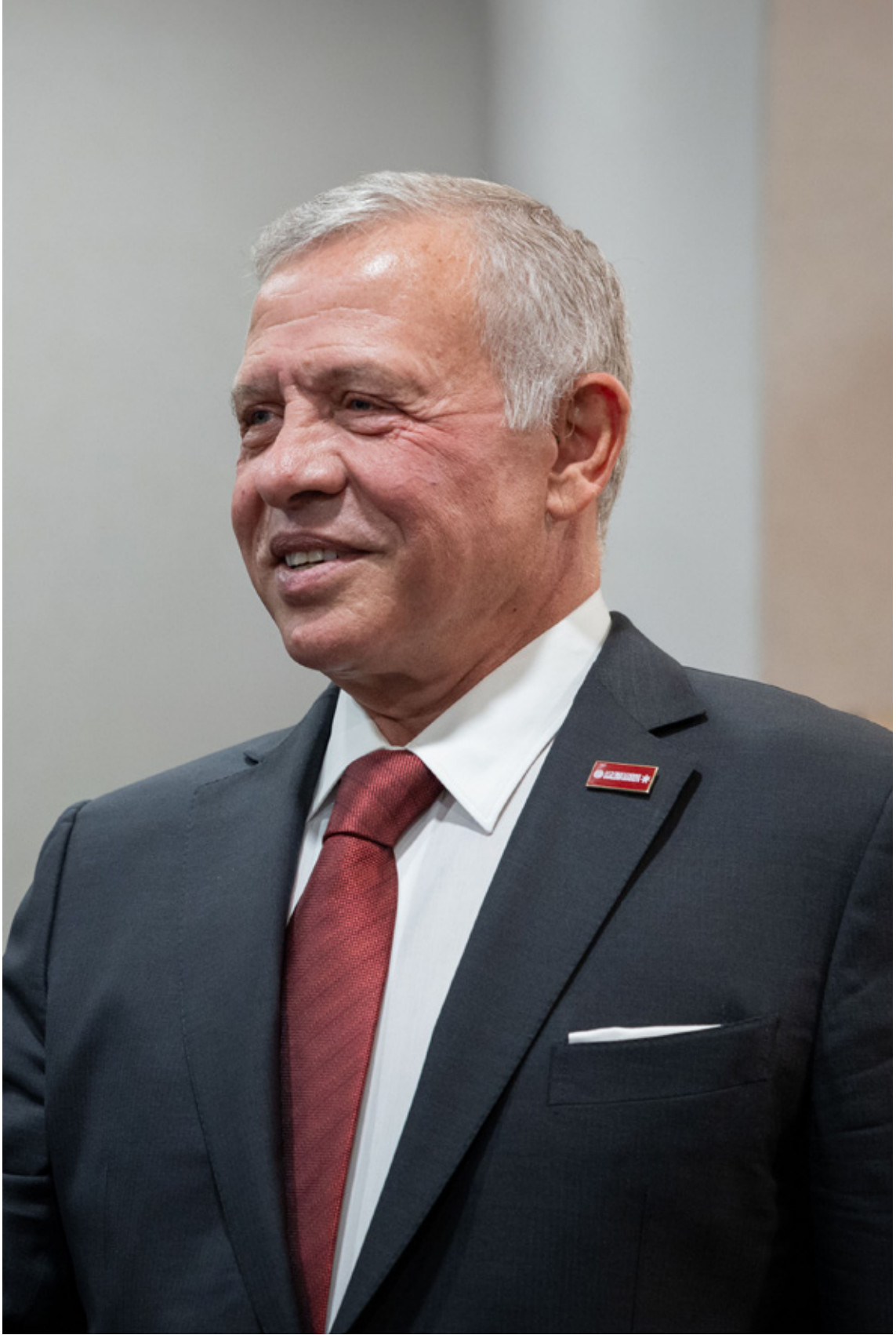
حضرة صاحب الجلالة الهاشمية الملك عبدالله الثاني ابن الحسين المعظم حفظه الله ورعاه