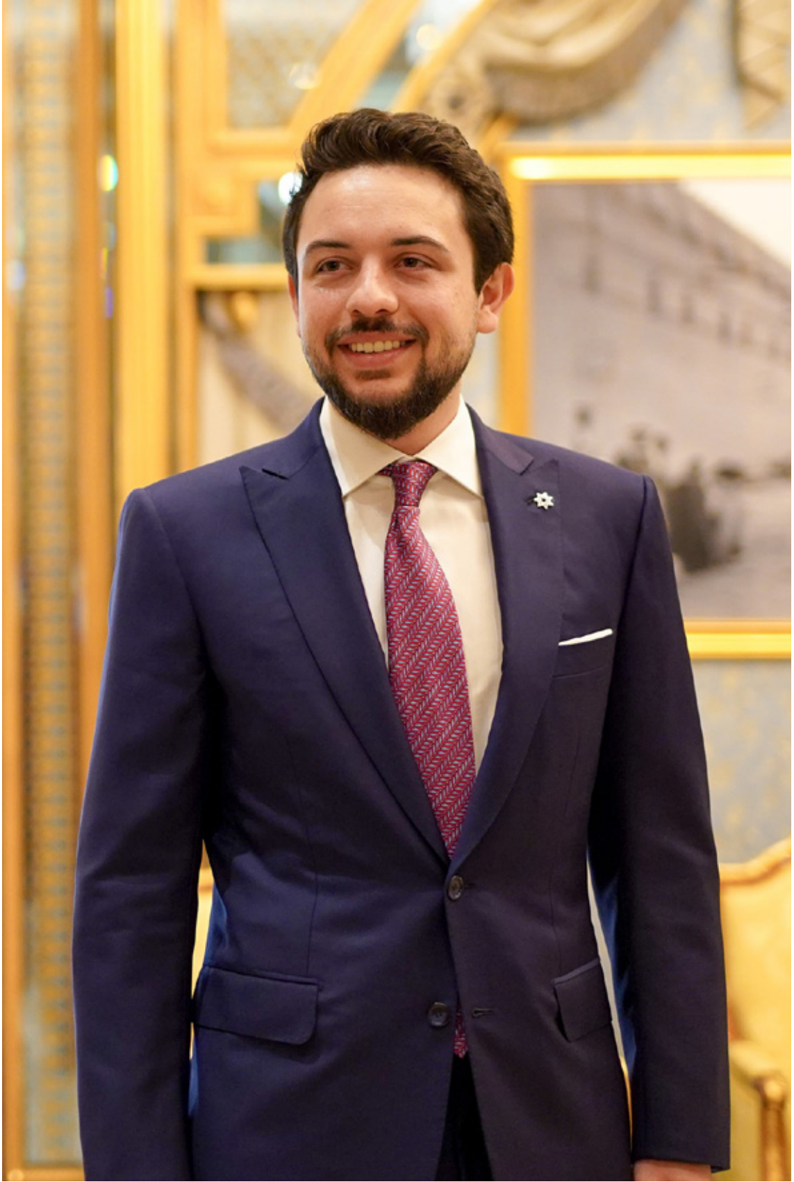
حضرة صاحب السمو الملكي الأمير الحسين بن عبدالله الثاني ولي العهد المعظم