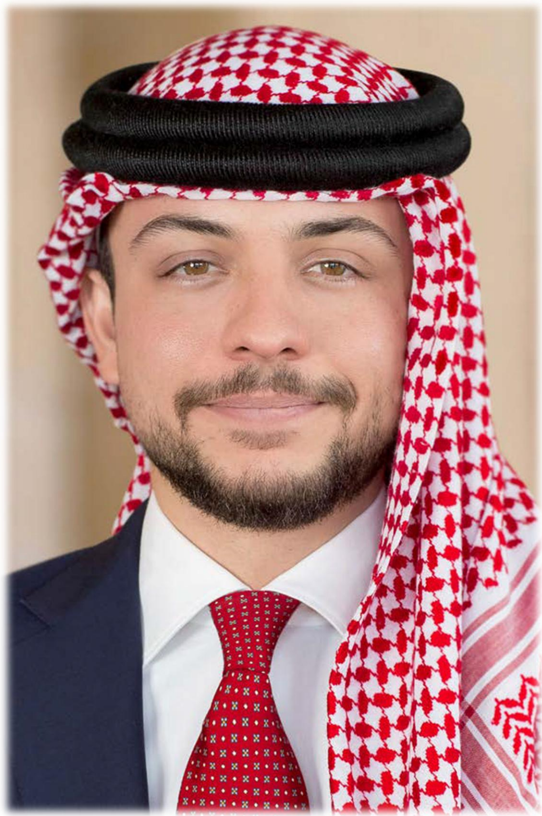
صاحب السمو الملكي الأمير الحسين بن عبدالله الثاني ولي العهد المعظم