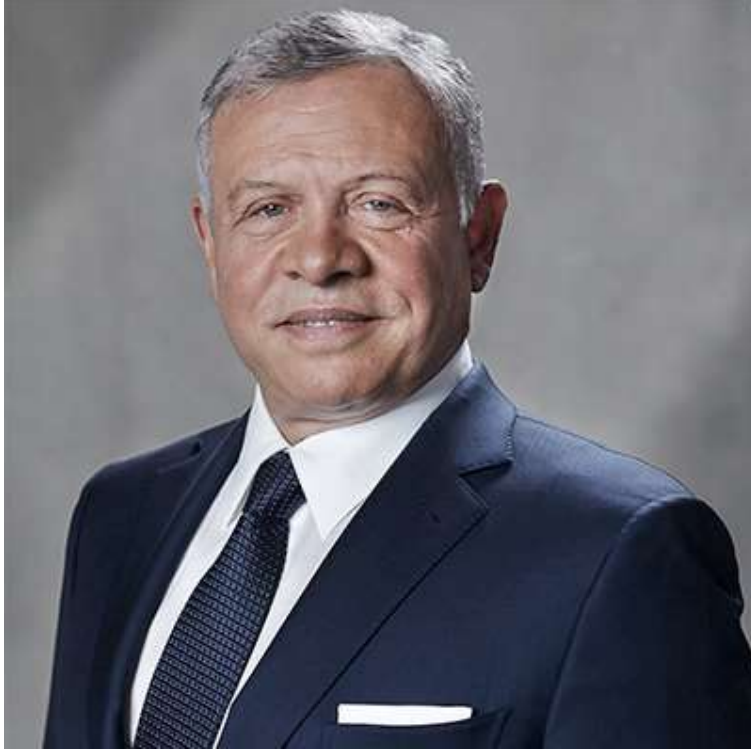
حضرة صاحب الجلالة ملك المملكة الأردنية الهاشمية عبدالله الثاني بن الحسين المعظم