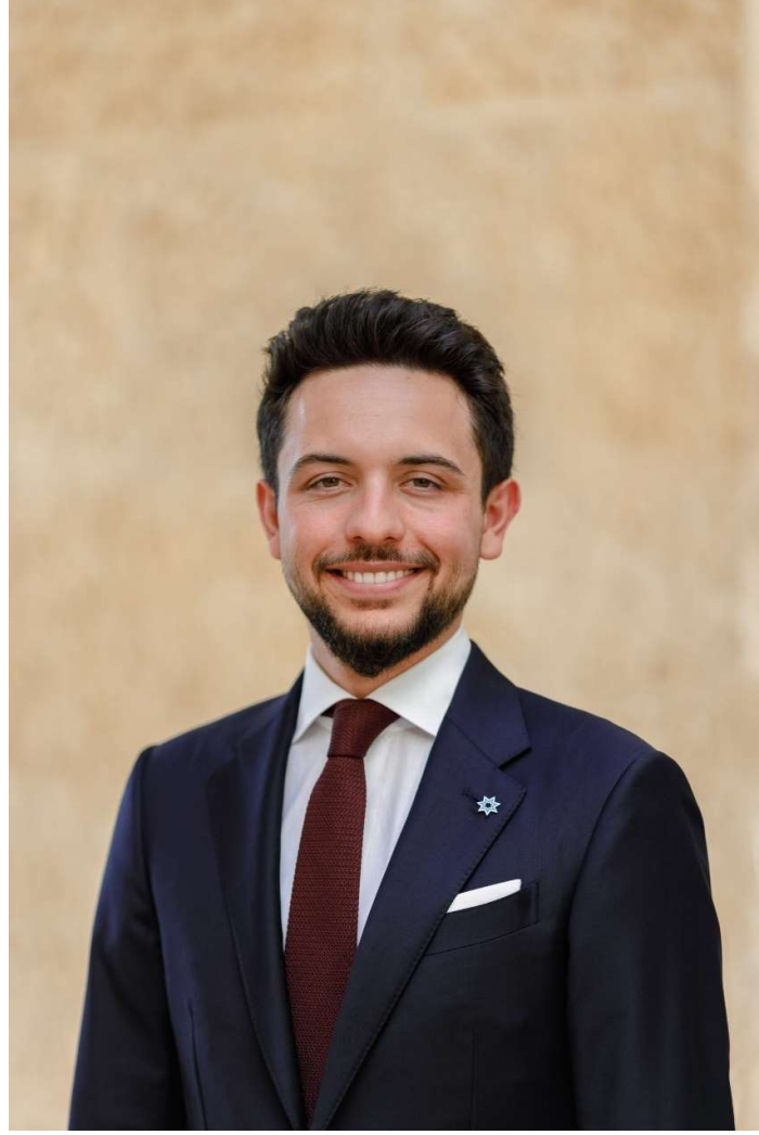
حضرة صاحب سمو الأمير الحسين بن عبدالله الثاني ولي العهد المعظم