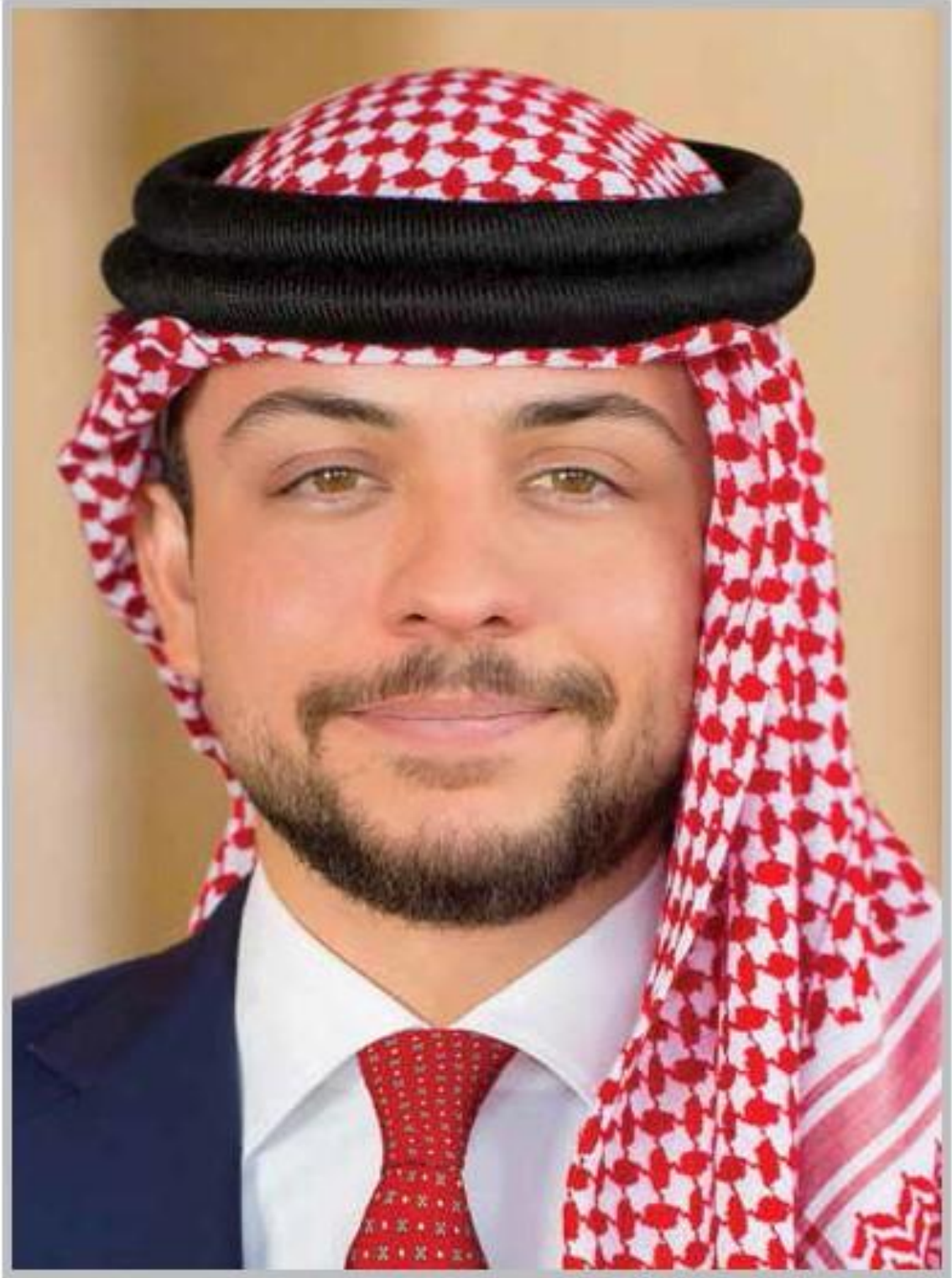
حضرة صاحب السمو الملكي ولي العهد الأمير الحسين بن عبد الله الثاني المعظم