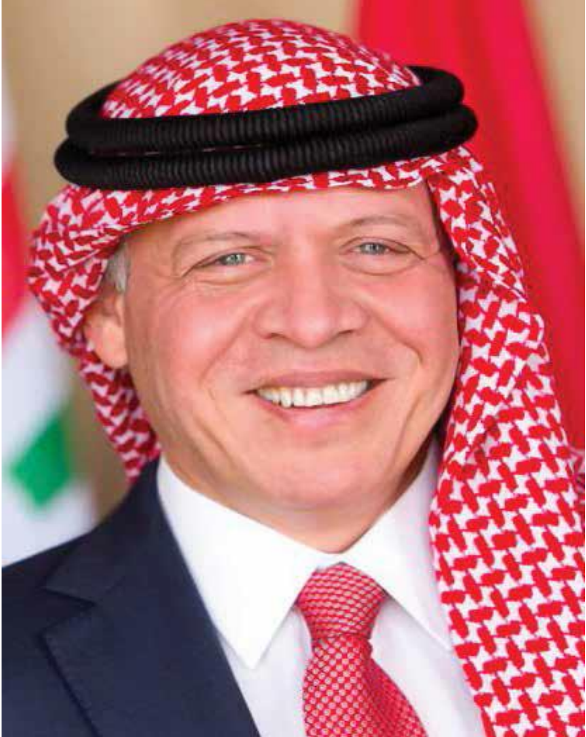
حضرة صاحب الجلالة الملك عبد الله الثاني بن الحسين المعظم (حفظه الله)