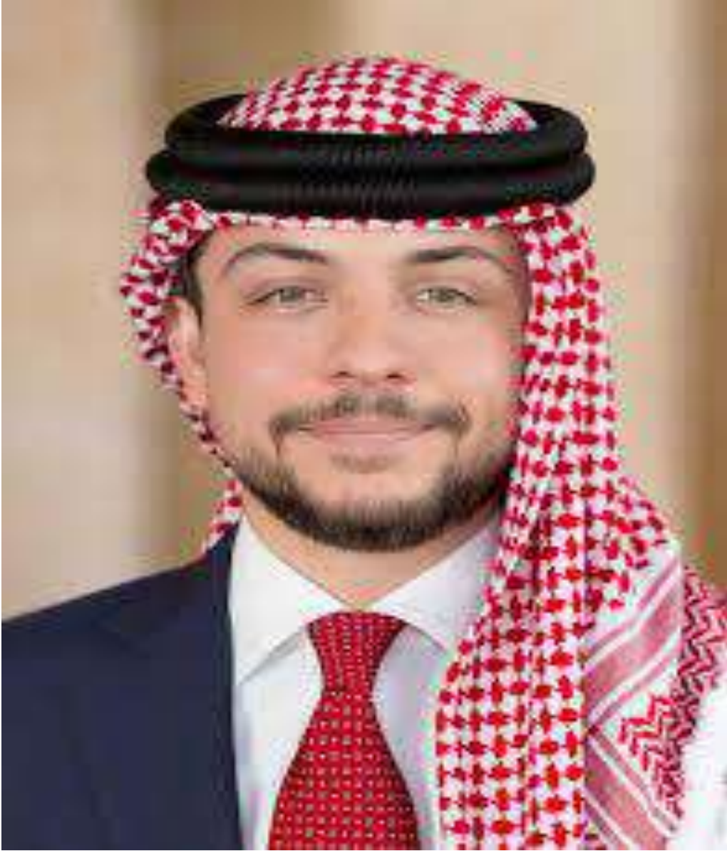
صاحب السمو الملكي الأمير حسين بن عبد الله حفظه الله