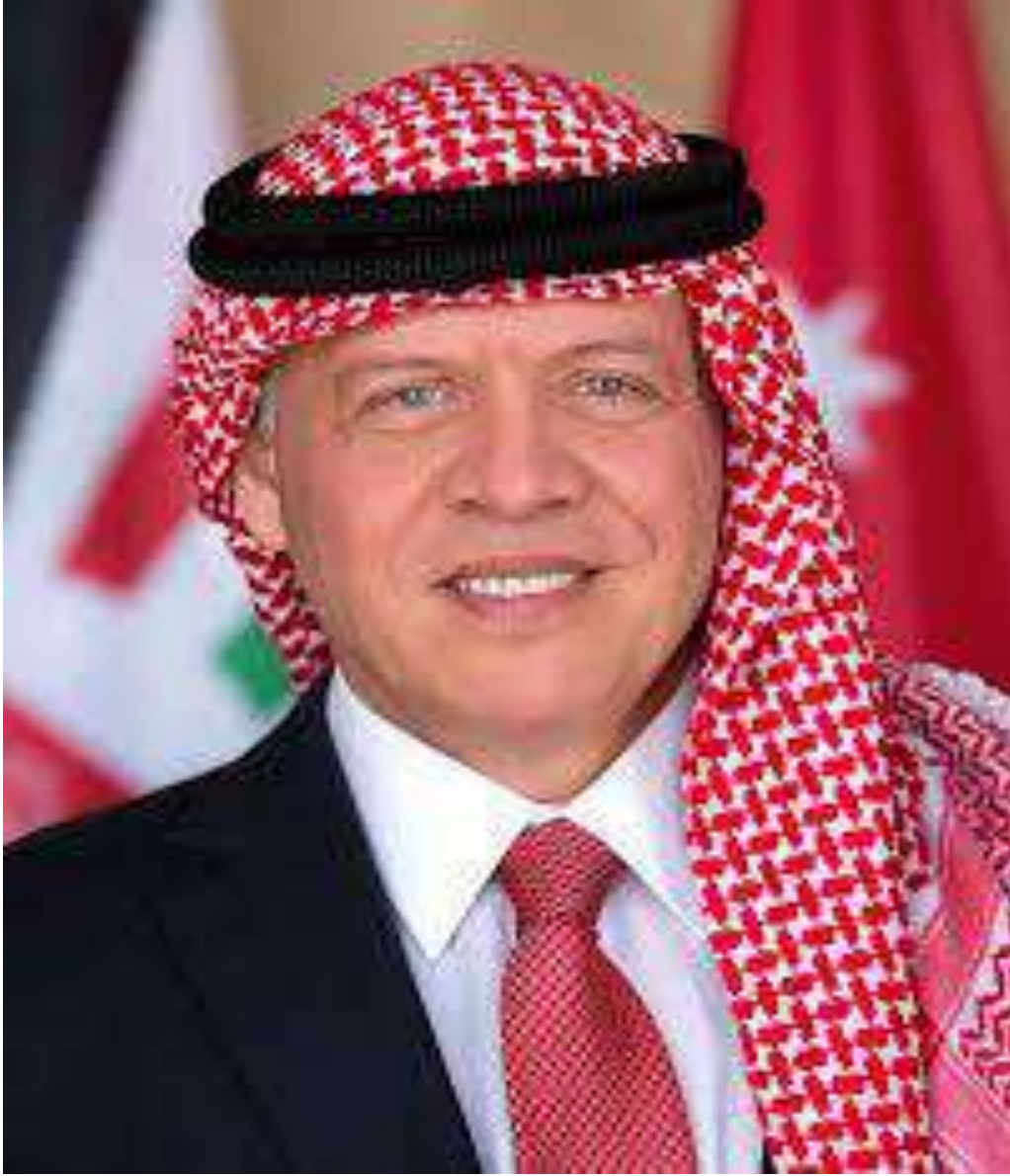
حضرة صاحب الجلالة الهاشمية الملك عبد الله الثاني ابن الحسين المعظم حفظه الله